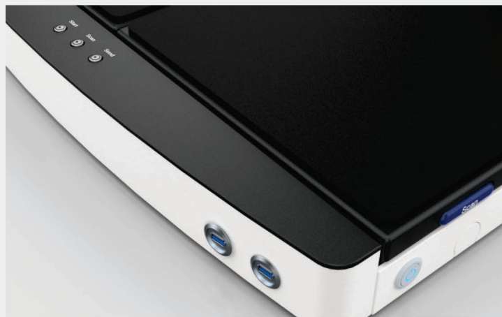
2 USB 3.0 Anschlüsse zum Speichern der Scans auf jedem USB-Stick