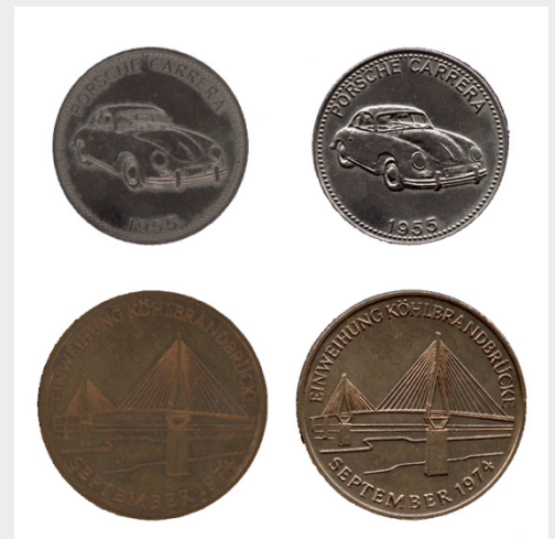
Escaneo 2D vs 3D, se capturan detalles