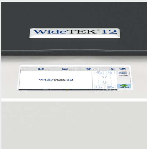
Pantalla de buen tamaño para facilitar la operación

El escáner se puede operar desde cualquier navegador estándar, mediante la pantalla táctil incorporada, o desde un dispositivo móvil como iPad o tableta Android usando nuestra aplicación para dispositivos móviles Scan2Pad®.