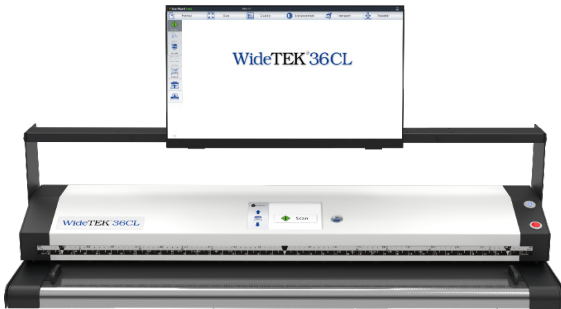
Touchscreen auf einem WT36CL - in zentraler Position montiert

Kein PC wird benötigt, alles kann über den Touchscreen erledigt werden, einschließlich des Versendens von Bildern über das Netzwerk an ein beliebiges Ziel in der Welt. Mit der integrierten ScanWizard-Funktionalität können Sie den Scanner und seine Einstellungen verwalten, zoomen und eine Vorschau Ihrer gescannten Bilder anzeigen, um höchste Qualität und Produktivität zu gewährleisten.