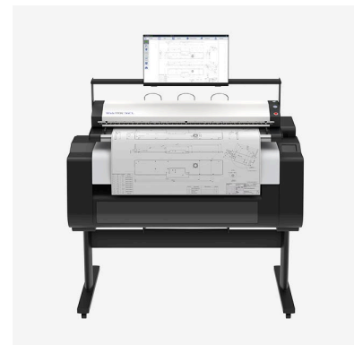
WideTEK® MFP-Lösungen für nahtlose Scan- und Druckprozesse im Großformat