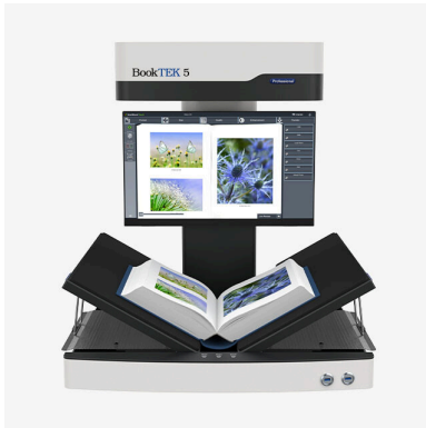
BookTEK® Buchscanner für gebundenes Beleggut in Formaten bis zu A1+

Image Access ist Technologieführer im Großformat-Scanning und bietet Lösungen für alle Segmente des Marktes an. Unsere Geräte werden in Deutschland entwickelt und gefertigt und stehen für höchste Qualität.