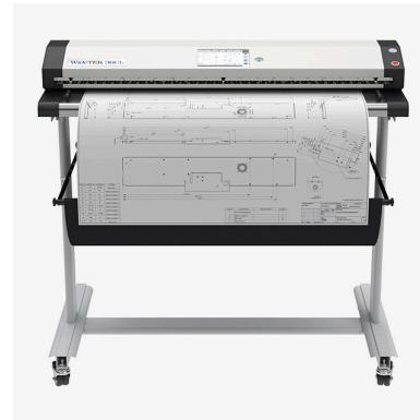
WideTEK® Einzugsscanner für Dokumente bis zu 60"