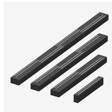
WideSCAN™ Machine Vision Produkte für die Optimierung moderner Produktionsprozesse