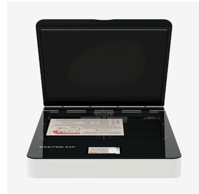
WideTEK® Flachbettscanner für Formate bis zu A1+ / 36"x24"