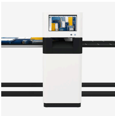
WideTEK® ART berührungsloser Kunstscanner für Formate bis 60"x80"