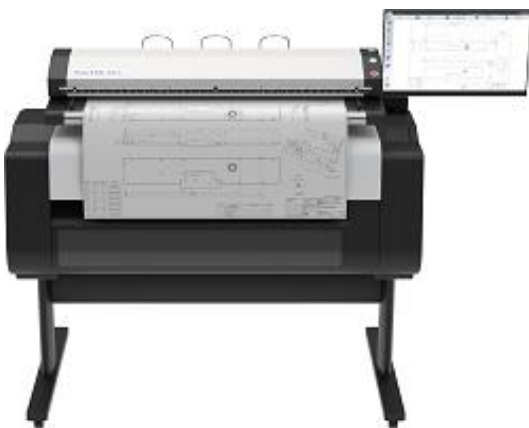
Bild: WideTEK 36CL-MF1 von vorne