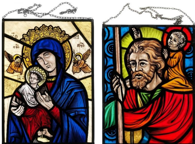
Buntglasfenster, gescannt mit Durchlichteinheit des WideTEK 36ART