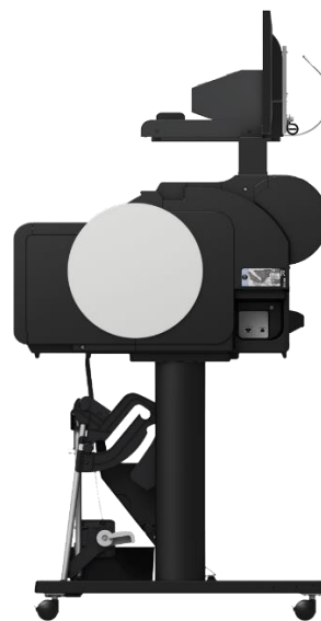
WideTEK 36CL-MF5 Seitenansicht