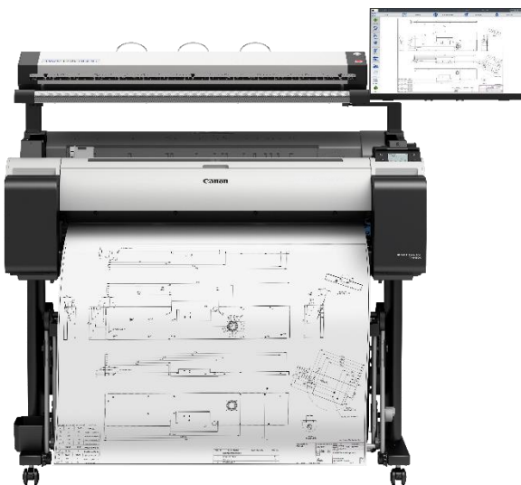
Der WideTEK 36CL-MF5 von vorne