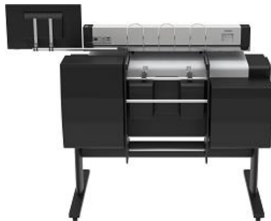
Bild: WideTEK 36CL-MF1 von hinten