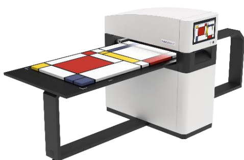
Kunstscanner WideTEK®36 ART