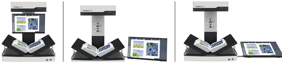
Buchscanner Bookeye® 5 V2 - verschiedene Monitorbefestigungen