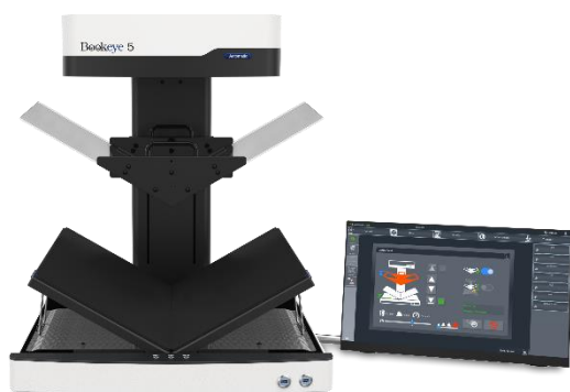
Der neue Bookeye 5 Automatic