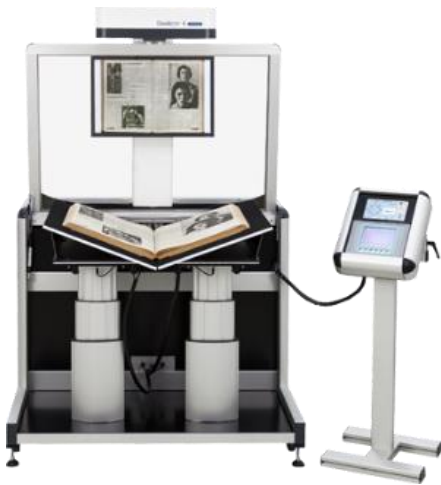
Großformatscanner mit motorischer Buchwippe