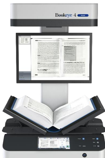
Aufsichtsscanner zur Selbstbedienung für Formate bis A3+